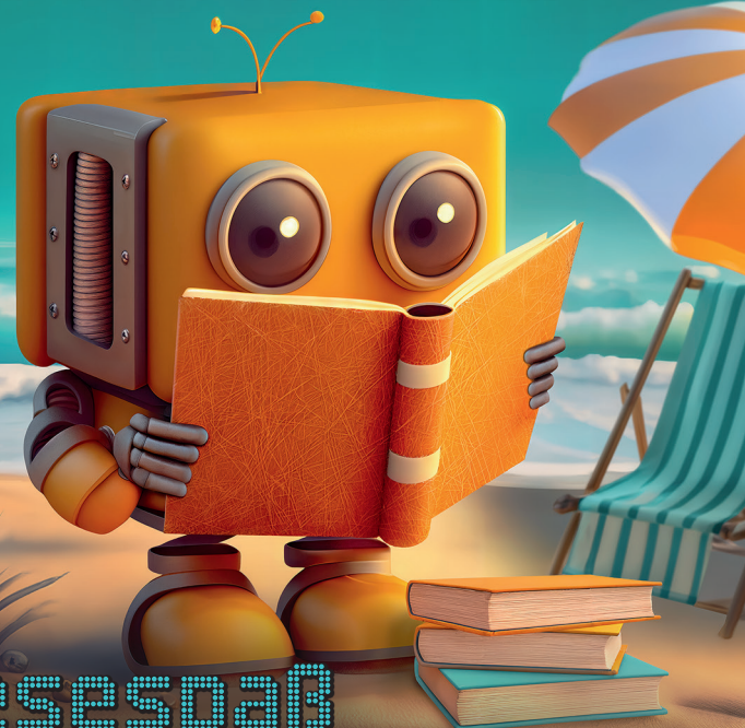
Abbildung mithilfe generativer KI erstellt.

15. JUNI - 16. AUGUST 2026 IN DEINER BIBLIOTHEK